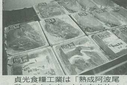
貞光食糧工業は「熟成阿波尾鶏」のもも肉、むね肉を並べて試食提供を行なった