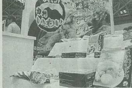
オヤマは「からあげ家 奥州いわい」のフラッグを掲げ「いわいどり」関連商品をPR