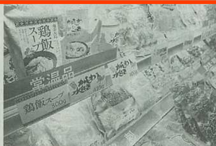
エヌチキンならではの種鶏肉や親鶏肉商品がずらり。南九州の鶏食文化も伝えた

大豆14ドル前後で推移 高温乾燥懸念で反発 8月11日の米国農務省(USDA)の需給予測では、6月前後の産地の日よりの約58セント安の4.75ドル前後、大豆相場(同)は約61セント安の13.93ドル前後で推移している。 需要や輸出も下方修正さ