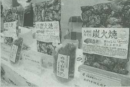
江夏商事は「ヤゲン軟骨の炭火焼き」などを出展。あえて周囲の肉を付けたまま焼き上げる