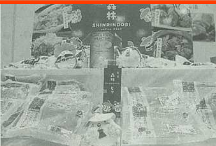
ウェルファムフーズは銘柄鶏肉「森林どり」を機能性表示食品としてPR