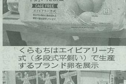
くらはちはエイビアリー方式(多段式平飼)で生産するブランド卵を展示